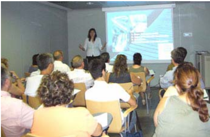
Expo2008: "Profesional del Departamento impartiendo clase". Octubre 2006

La Sociedad Expoagua ha firmado un convenio de colaboración con el Gobierno de Aragón con el fin de que las personas que lo deseen, puedan recibir la Formación General on line a través de la plataforma electrónica Aula Aragón. Todas aquellas personas que dispongan de dirección electrónica y que deseen formarse a través de la red, recibirán vía correo una clave para acceder a la formación on line.